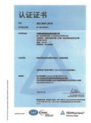
ISO 9001 質量管理體系 認證證書

為充分確保並驗證本公司具備持續提供滿足市場與用戶需求的產品及服務質量保證能力，本公司嚴格按國家體系認證監管要求，每年定期接受資質認可權威機構審查，獲頒發的專業體系證書並保持。為本公司產品准入並參與國內外市場競爭提供有力支撐和保障，增強企業綜合競爭力，推動企業健康、可持續發展。