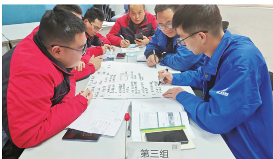
倉庫成本控制培訓

為切合不同員工的發展方向，本集團制訂多種類的培訓，讓員工充分利用上班及工餘的時間進行基礎知識、技能、拔高知識的學習，提升自我，高效學習。本年度，本集團為員工提供的課程類型多樣，例如使用python及java程序語言、產業化採購管理、業務優化及開發、成本分析、品質體系、現場管理、銷售等與其崗位相關的能力提升培訓。此外，本集團也提供新員工入職培訓，包括入職通用知識培訓及崗前培訓，加快新員工業務技能的提升。