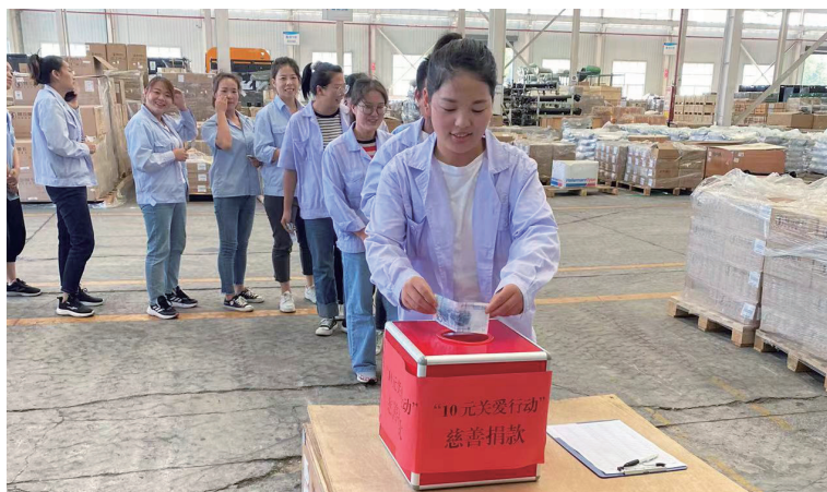
十元關愛行動慈善捐款倡議活動現場