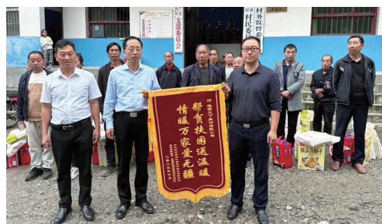
向商洛市鎮安縣達仁鎮雙河村捐贈生活必需品

2023年6月17日，在商洛市鎮安縣達仁鎮的雙河村，本集團組織了一場名為「助力鄉村振興愛心捐贈」的公益活動。這項活動專注於支援20戶當地困難群眾，本集團員工積極參與並捐贈了總價值達12,000元的生活必需品，包括米、面、油等基礎物資，以幫助改善他們的生活條件，展現了集團對鄉村振興的支持與對困難群眾的關懷。