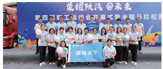
第四屆職工運動會及半程馬拉松比賽