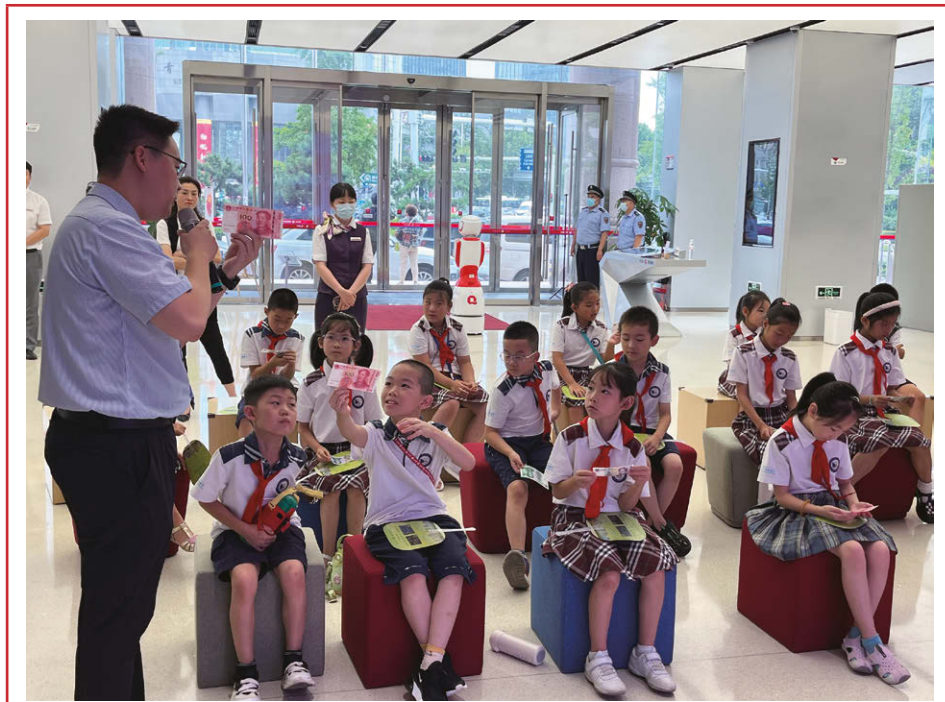
2023年8月，本行開展「小小銀行家」金融實踐活動。

本行高度重視消費者權益保護工作，切實履行金融消費者權益保護主體責任，牢記「金融為民」的初心。一是推動服務口碑塑造，深化服務向善落地，把落實消費者權益保護監管政策作為服務管理的生命線。2023年，本行客戶滿意度淨推薦值為80.49%，同比提升3.79個百分點；本行第八次問鼎全球服務領域最高獎項「五星鑽石獎」，服務口碑始終處於行業領先地位。二是進一步健全消費者權益保護體制機制，嚴格施行投訴閉環管理機制，確保消保工作依法合規開展。三是持續完善消費投訴考核監測機制，切實維護金融消費者合法權益。四是加大資源投入，更新迭代投訴管理系統，報告期內，本行上線全渠道覆蓋、全週期監測的「青島銀行客戶之聲管理系統」，建立一鍵轉辦、一鍵督辦、審核考核全程留痕閉環管理模式，實現了跨部門、跨機構的客戶投訴信息互通、數據互聯，標誌著本行數字消保管理價值化再上新台階。