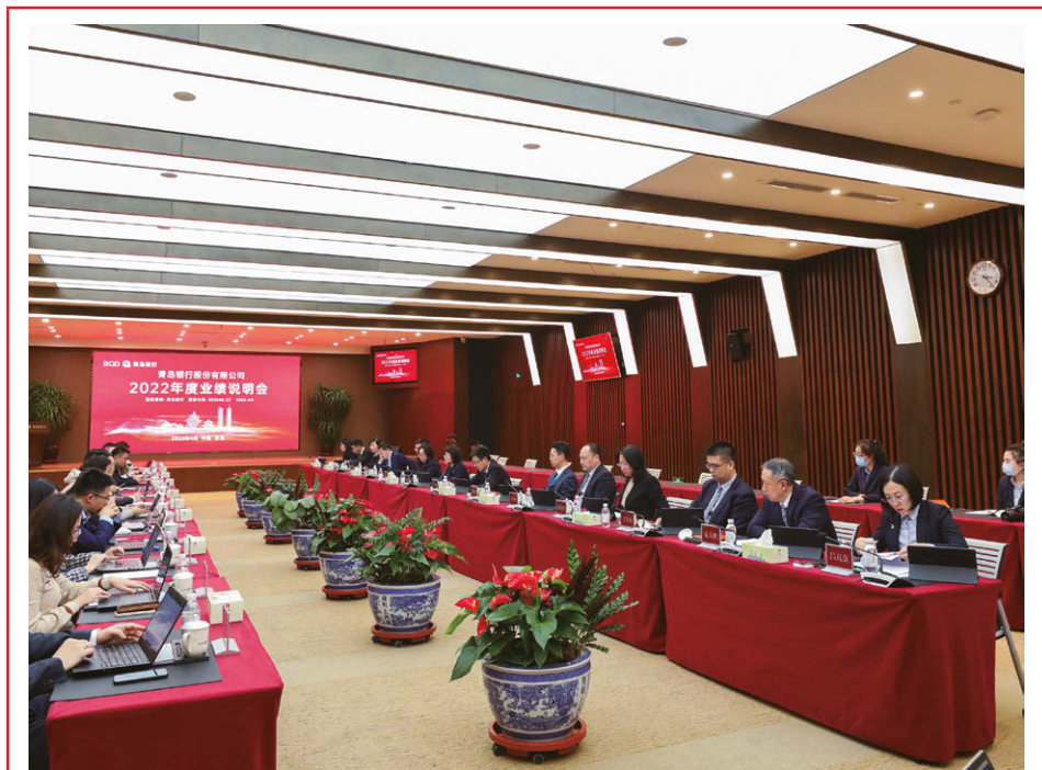
2023年4月，本行成功組織召開2022年度業績說明會。

報告期內，本行在「21世紀金融發展優秀案例」評選中獲評「年度科技銀行」稱號，「集團級智能化預警平台」獲評「金融科技優秀項目」一等獎，是連續第三年在數字金融創新評選活動中斬獲最高獎項。「對公線上營業廳管理平台」「零售智能營銷管理平台項目」「線上交易監控平台」「遠程銀行」等多個項目在各類金融科技創新大賽評選中榮獲大獎。