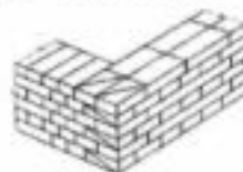
图 F506-1 一顺一丁砌法

F506-1)、三顺一丁和梅花丁(同一皮中丁砖与顺砖相间排列)的砌筑形式,砌筑方法一般采用“三一”砌法,即用大铲一铲灰、一块砖、一挤揉的砌筑方法。