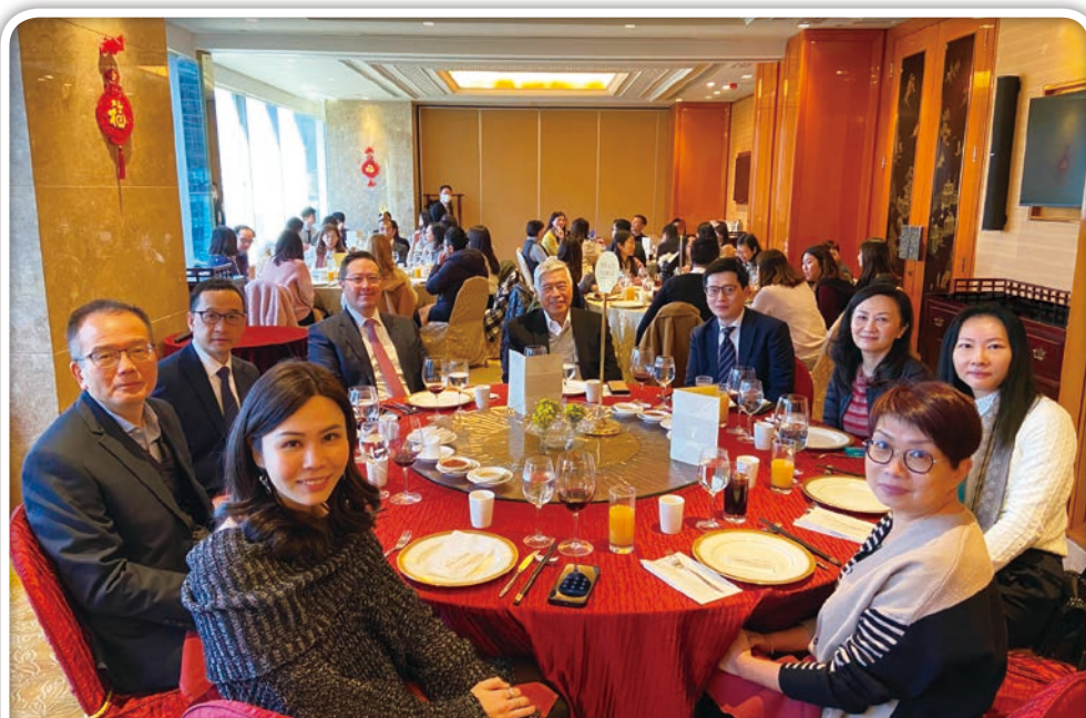
二零二三年節日午餐