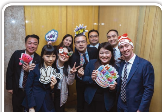
二零二三年週年晚會