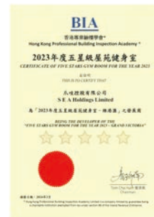
香港專業驗樓學會： 2023年度五星級屋苑健身室