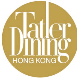
The Tatler Dining Awards 2023