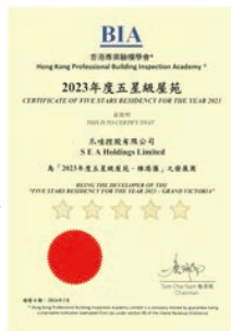
香港專業驗樓學會： 2023年度五星級屋苑