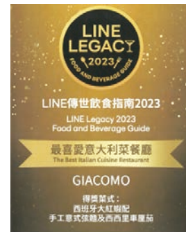
LINE 傳世飲食指南 2023： 最佳意大利菜餐廳 — GIACOMO