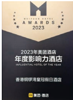
2023年美團酒店： 年度影響力酒店