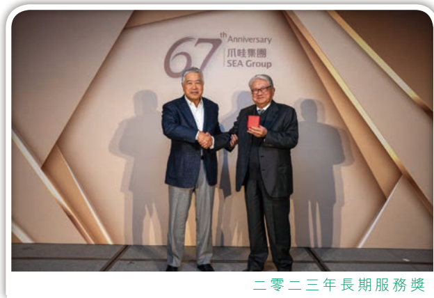
二零二三年長期服務獎