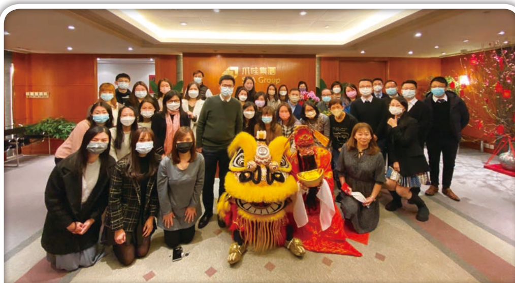
二零二三年舞獅活動

日後，本集團將不斷評估其管理方法，以保持遵守相關法律法規。倘出現違規舉報，本集團將以公正合法的方式進行處理。