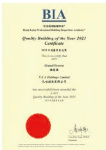
香港專業驗樓學會： 2023年度優秀屋苑獎