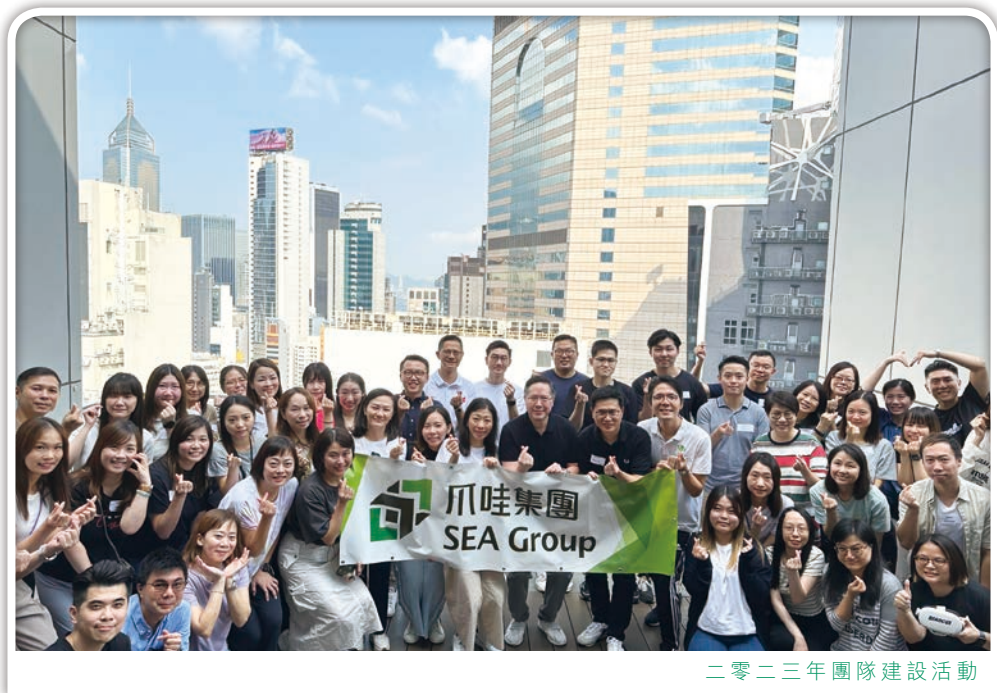
二零二三年團隊建設活動