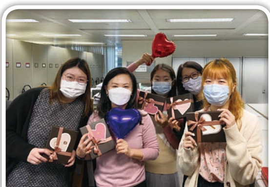
二零二三年情人節

此外，爪哇集團於佳節會送上應節禮品予員工，以表達對僱員的感情。二零二三年情人節、復活節、端午節及中秋節，本集團分別向員工贈送巧克力禮盒、復活節禮盒、時令粽子及月餅。此外，本集團亦向每名員工送上生日禮物。發放禮品不僅為讓僱員在節假日得到休息，亦讓彼等感受節日氣氛。另外，本集團為全體員工安排午餐，慶祝傳統節日。通過該等安排，本集團向僱員致以誠摯的謝意，感謝彼等一直以來的辛勤付出。