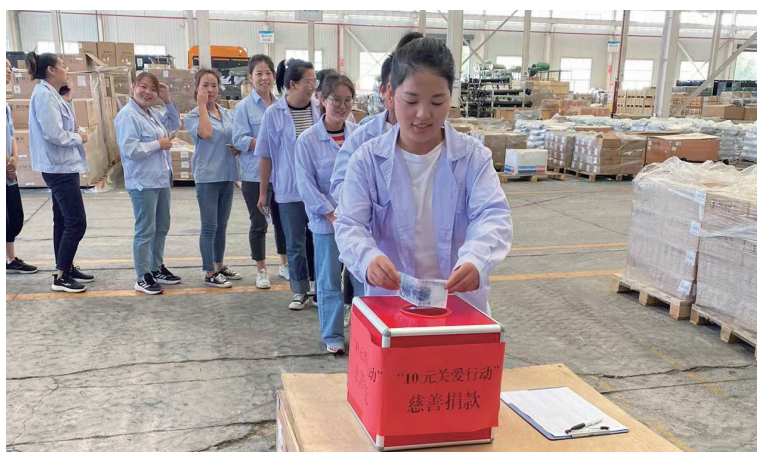
十元關愛行動慈善捐款倡議活動現場