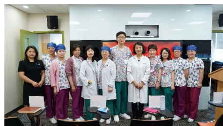
北京新世紀兒童醫院兒童哮喘診療中心掛牌成立