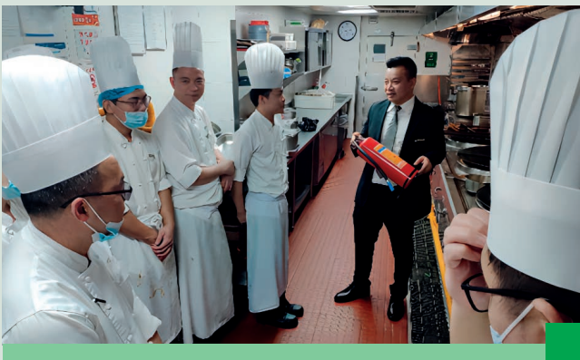
廚房員工安全培訓

大慶富力喜來登酒店於第四季度開展酒店消防疏散演練，邀請專業消防機構對員工進行消防安全培訓和現場指導，並模擬真實的火災場景，幫助員工了解突發火災的應對方式，防毒面具的使用，以及酒店火警處置程序和疏散路徑。