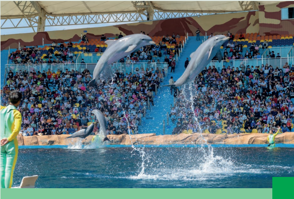
「海南富力海洋歡樂世界」

本集團一直遵守相關法律法規，透過持續評估及管理業務營運，竭力保育生物多樣性及生態系統。為確保業務營運不會嚴重破壞周邊的生態和環境，我們會在項目前期開發階段進行環境生態評估，避免在國家自然保護區範圍內發展項目，並以最大力度積極推動生態系統的恢復。在整個項目周期中，我們團隊會在施工過程中積極採取生態復原措施，修復受施工項目影響的環境區域，實現項目和生態環境的永續發展。