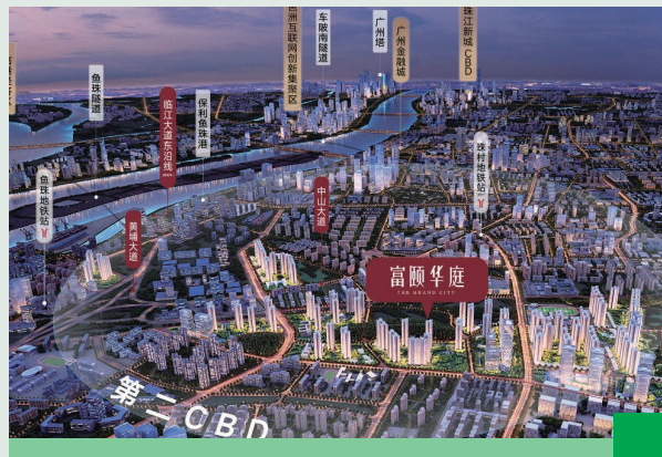
茅崗路以西城中村改造項目4-3地塊安置房住宅