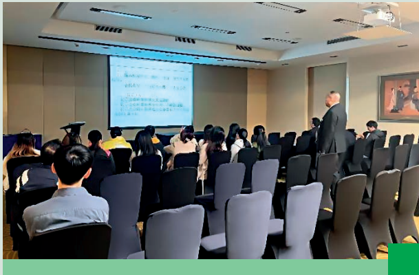
職業安全及員工健康培訓會議

惠州龍門富力嶺南花園溫泉度假山莊針對食品安全開展講座和培訓活動，圍繞食品安全議題進行深入分析，幫助員工了解食品安全注意事項以及處理流程等。