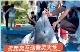
近距离互动微笑天使 原来笑容真的很治愈~

年內，富力海洋歡樂世界以承擔公共責任為己任，積極投身公益關愛行動，向全社會自閉症兒童及家庭發起邀請，共同參與關愛「星星的孩子」公益日活動並與三亞市特殊教育學校三亞六道幼稚園、藍海保育救護中心攜手，讓更多的「星星的孩子」在全社會的愛心與關注下更加自信、快樂地生活與成長。