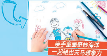
亲手重画奇妙海洋 一起绘出天马想象力