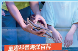
童趣科普海洋百科 海洋神奇故事生动讲述~