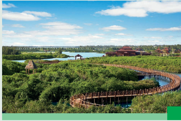
「海南紅樹林濕地保護公園」

為保護生態及生物多樣性，本集團推行藍海保育計劃，與政府合作進行生態共建，打造了海南首家功能最完善的海洋動物醫院及藍海保育中心，承擔檢疫和近海海洋動物救護工作，被譽為動物界的「三甲醫院」，踐行保育與發展並行。截至二零二三年十二月三十一日，藍海保育中心已救助和放歸玳瑁、綠海龜和中華鱉等數百隻海洋動物。我們希望透過藍海保育中心，教育下一代了解海洋生態保育的知識和重要性。