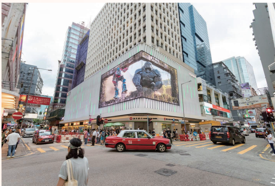
圖1：於尖沙咀的恒生尖沙咀大廈正在運作的WrapLED

本集團尤其為可拆卸LED解決方案感到自豪，此方案能提供更高效節能的廣告。其在白天顯示靜態圖像，而入夜後，節能LED屏幕才會開啟，從而有效地減少了廣告牌的總體電力消耗。除了於上一報告期間在尖沙咀北京道一號的安裝外，本集團亦於報告期間在尖沙咀的恒生尖沙咀大廈進一步安裝可拆卸LED解決方案（WrapLED）。WrapLED利用可拆卸的LED裝置，旨在為廣告客戶提供更節能的廣告方案。