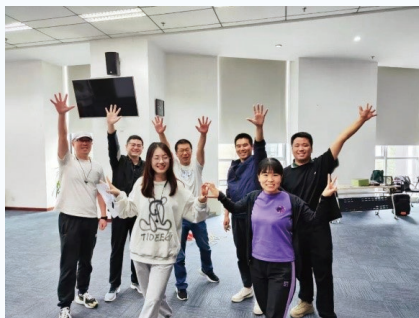
「擁抱美好 盡享樂動」活動