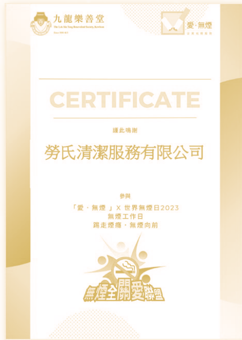
樂善堂頒發的「愛·無煙」x 世界無煙日2023感謝狀

透過與環創社合作，勞氏清潔於推廣環保意識方面取得正面的成果。勞氏清潔相信，這些活動在促進環保行動的普及和實施方面發揮著重要作用，有助於創建一個更加綠色和可持續發展的社會。