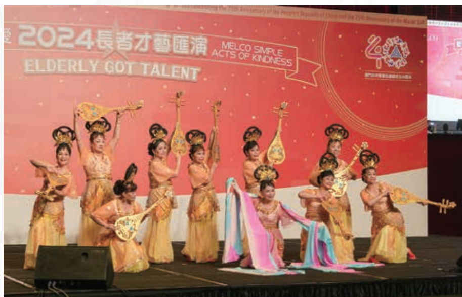
本集團與澳門街坊會聯合總會攜手合辦「新濠小善大愛2024長者才藝匯演」，讓一眾長者在籌備表演過程中找到意義和樂趣。

澳門新濠鋒於截至二零二四年六月三十日止六個月的非博彩收益總額為9,900,000美元，而二零二三年同期為8,600,000美元。