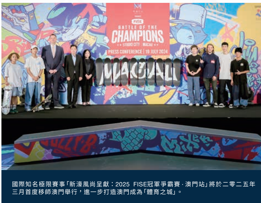
國際知名極限賽事「新濠風尚呈獻：2025 FISE冠軍爭霸賽·澳門站」將於二零二五年三月首度移師澳門舉行，進一步打造澳門成為「體育之城」。

作為在休閒娛樂業界領先全球的營運商，新濠國際不斷探索及推行創新的企業管治及可持續發展策略。本集團的核心價值根植於對卓越的堅定追求，以最高標準的企業管治作為基石，並以可持續發展為動力，推動未來增長。這種對卓越的不懈追求，使本集團於期內在國際舞台上贏得業界及社會的廣泛認可。