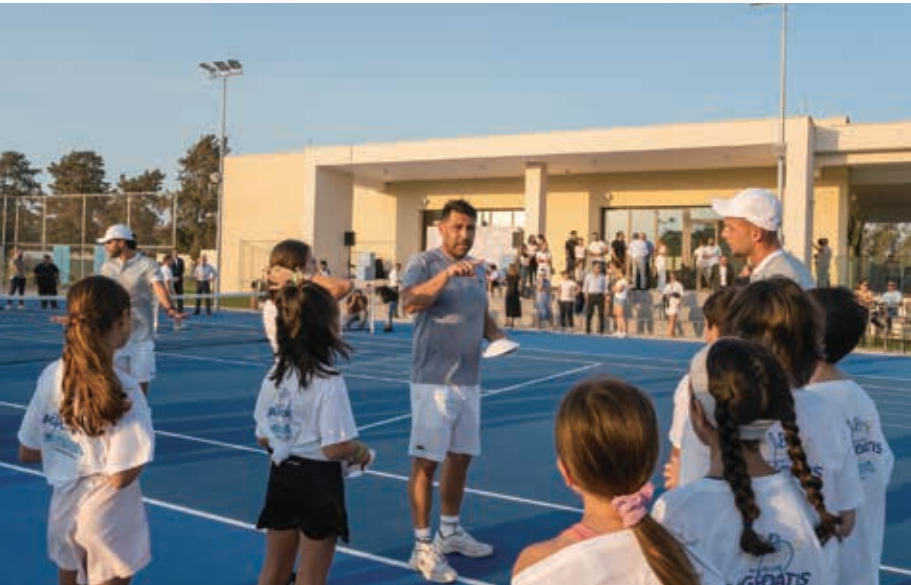
City of Dreams Mediterranean在開業後進行了大幅度的物業優化，包括設立Marcos Baghdatis Tennis Academy，在設備先進的網球場上提供頂級網球體驗。

對本集團而言，二零二四年上半年是充滿活力的時期。澳門這個主要市場呈現出強勁的復甦跡象，訪澳旅客人數較二零二三年同期上升43.6%，現已達到二零一九年上半年疫情前水平的82.4%。中國政府近期宣佈的策略措施，包括推出澳門至橫琴的多次往返團隊旅遊簽證、於二零二四年三月及五月將個人遊計劃擴展至更多內地城市、簡化中國首二十大城市居民的網上簽證申請程序、加上構思中的港珠澳大橋深圳連接線，均有助提升澳門的交通便利性，並擴大本集團的客戶基礎。