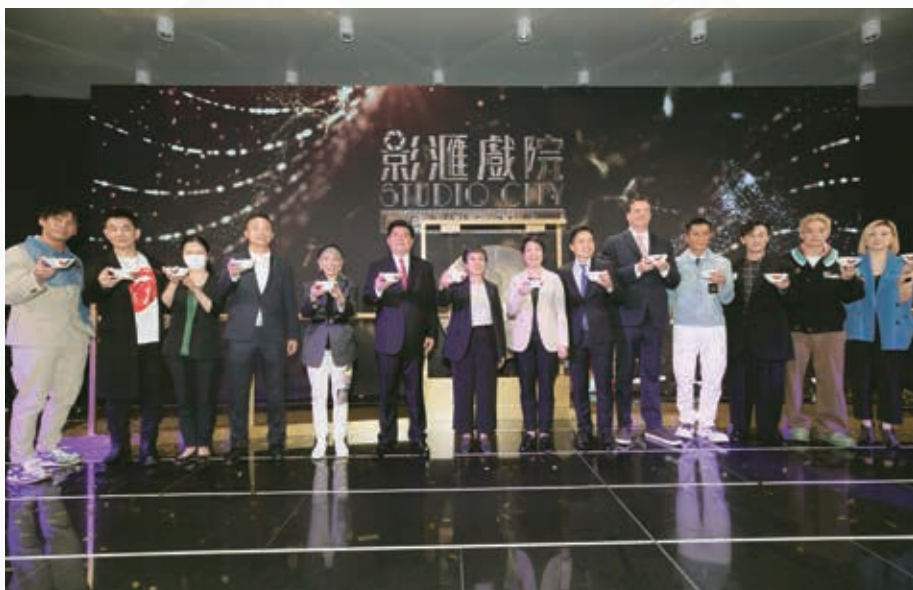
影滙戲院的盛大開幕充分展現本集團在豐富澳門娛樂體驗及推動其多元經濟發展方面的貢獻。

澳門以外，座落於馬尼拉娛樂城入口處的新濠天地(馬尼拉)極具策略位置優勢，為東南亞市場提供無可比擬的精彩娛樂及住宿體驗，並繼續印證本集團兌現其國際願景的實力。這個多姿多彩的項目雲集極尚娛樂、酒店、購物、餐饗及生活時尚體驗，並提供包括貴賓廳及中場博彩設施在內的多元化博彩體驗。新濠天地(馬尼拉)於二零二四年上半年平均營運約269張賭桌及2,279台博彩機。