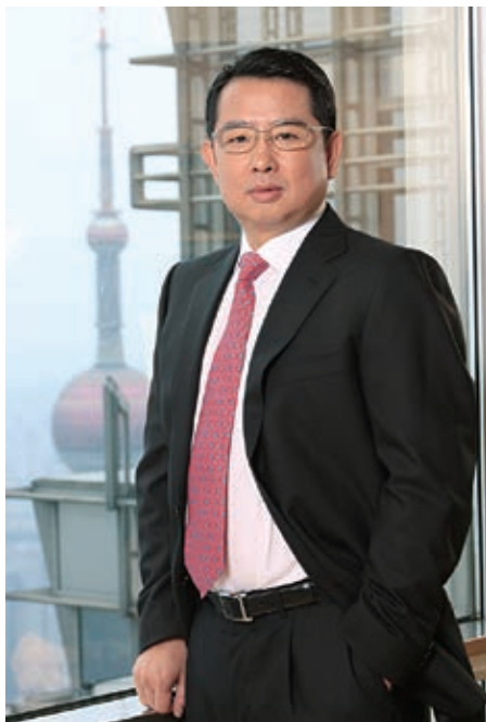
宏信建設發展有限公司 董事會主席及非執行董事