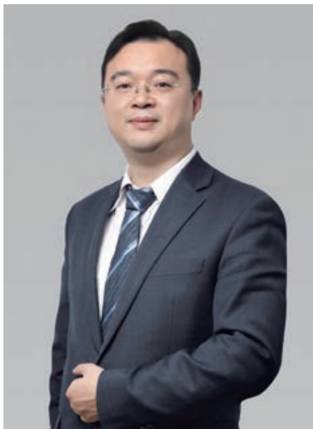
宏信建設發展有限公司 執行董事及首席執行官