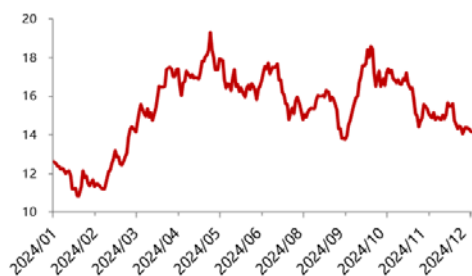
2024 年紫金礦業 A 股股價走勢（人民幣：元）