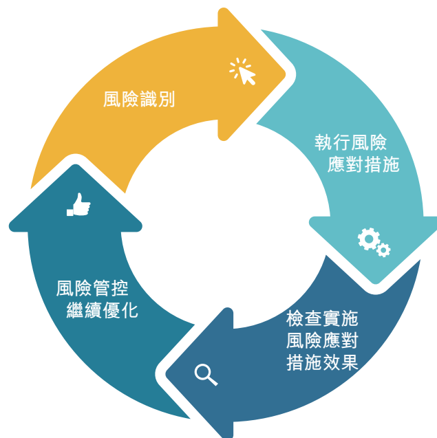
圖二：風險評估管控模式

本年度，本集團管理層通過對上年度風險評估中識別的管控提升點的落地情況進行跟進，形成持續的「風險識別 — 風險管控落地 — 檢查跟蹤 — 持續優化」的循環管控模式，確保重大風險管理薄弱點得到有效改善，以持續提升本集團的風險防範與應對能力(詳見以下圖二：風險評估管控模式)。