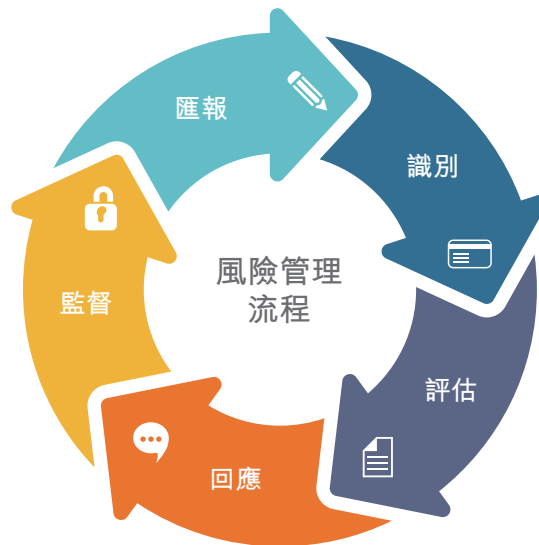
圖一：風險管理流程